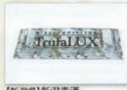
【新潟県】新潟麦酒 トリュフゼリー インナービューティ