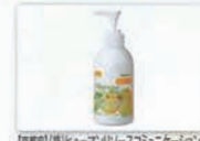
【福岡県】(株)ヒューマンリソースエージェンツ Nursery(ナーサリー)Wクレンジング ジェル 京都・水尾産ゆず コスメティック