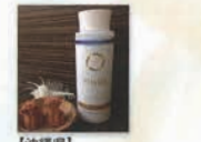
【沖縄県】 (株)パフックホスピタリティーグループ UMUI The therapist シリーズ コスメティック