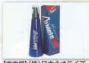
【東京都】(株)日本ネオライズ マテリア アスリート プロ その他企画