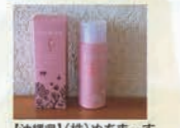
【沖縄県】(株)ぬちまーす リュウミネシルクソルト コスメティック