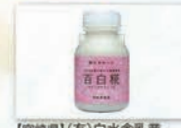
【宮崎県】(有)白水舎乳業 百白粧 (ひやくびやくこうじ) インナービューティ